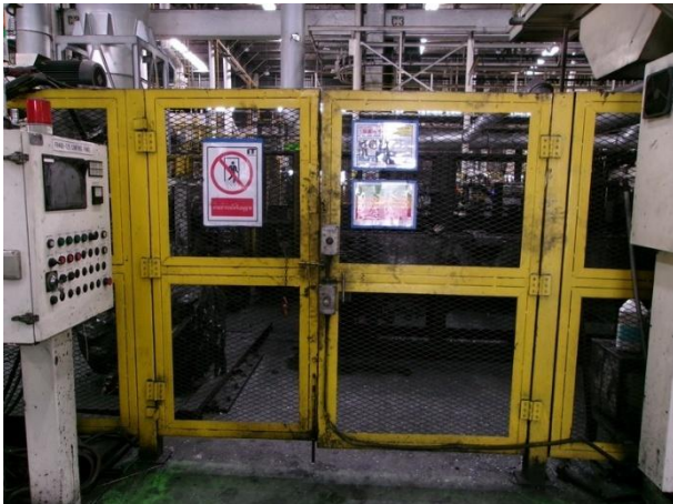
รูปที่ 2-47 การติดตั้งรั้วล้อมรอบบริเวณหุ่นยนต์แขนกลสำหรับหยิบชิ้นงาน และมีระบบ Safety plugs