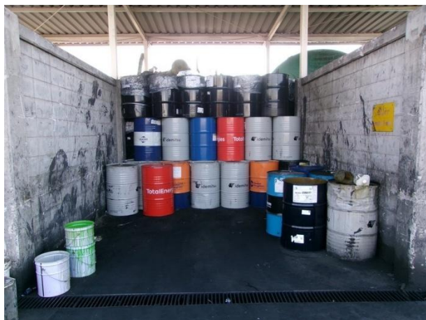
รูปที่ 2-21 น้ำมันเสื่อมสภาพ ในโรงเก็บขยะ