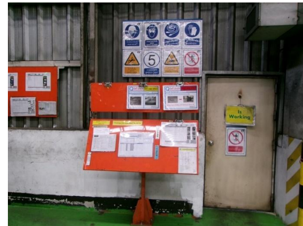
รูปที่ 2-45 ติดตั้งป้ายเตือนหรือสัญลักษณ์ประเภทอุปกรณ์ป้องกันอันตรายส่วนบุคคลที่ต้องสวมใส่บริเวณหน้าประตูทางเข้าบริเวณปฏิบัติงาน