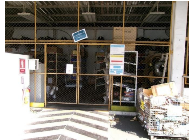
รูปที่ 2-44 สต็อกอุปกรณ์ป้องกันอันตรายส่วนบุคคล