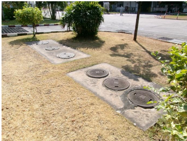
รับน้ำเสียจากห้องน้ำ-ห้องส้วมโรงแม่พิมพ์