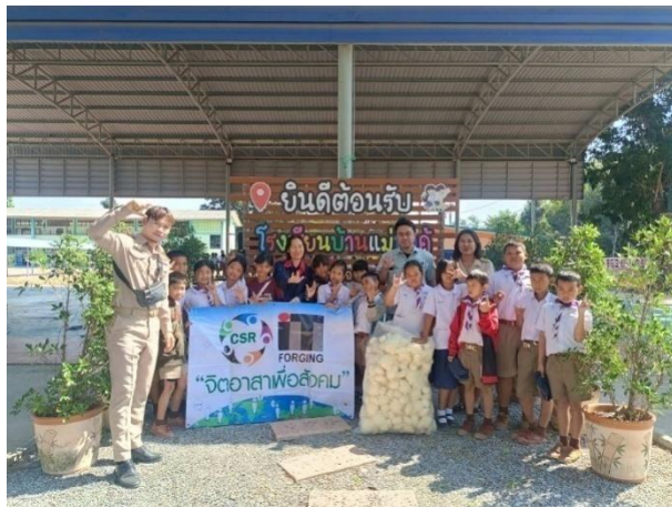
มอบของขวัญวันเด็ก