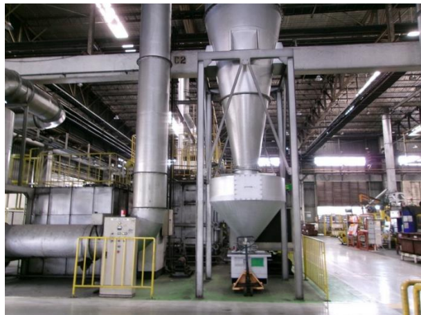
รูปที่ 2-1 ระบบบำบัดมลพิษทางอากาศแบบไซโคลนเพื่อบำบัดมลพิษทางอากาศ ที่เกิดจากเครื่องทุบขึ้นรูปขนาด 6300 ตัน