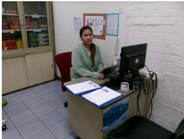
เจ้าหน้าที่ประจำห้องพยาบาล