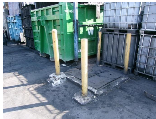
รูปที่ 2-26 บ่อดักน้ำมันขนาด 1.5 ลูกบาศก์เมตร