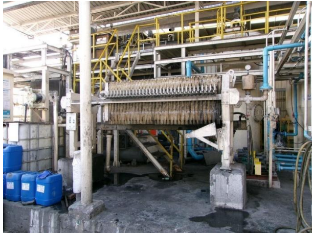
รูปที่ 2-50 พาเลทรองรับการรีดตะกอนจากระบบบำบัดน้ำเสียทางเคมี