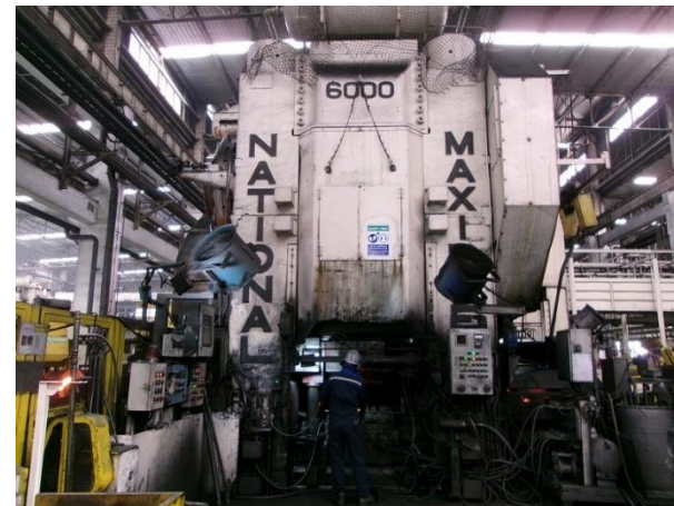
รูปที่ 2-31 ติดตั้งพัดลมระบายอากาศให้กับพนักงานที่ต้องปฏิบัติงานบริเวณเครื่องทุบขึ้นรูป