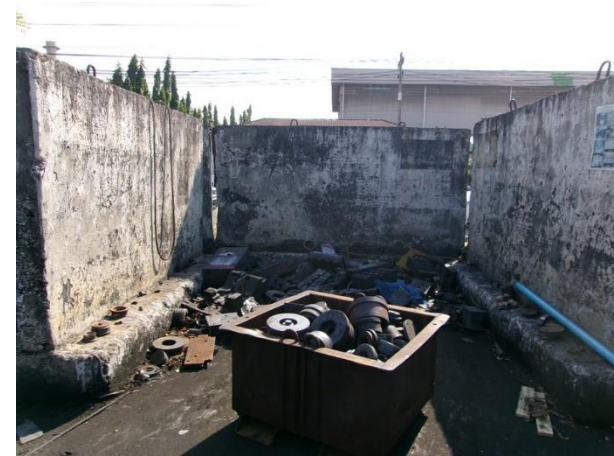
รูปที่ 2-15 เศษเหล็ก ในพื้นที่เก็บเศษเหล็ก