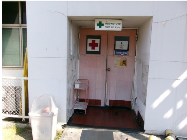
ห้องพยาบาล