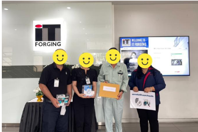
มอบเวชภัณฑ์ให้ รพ.สต.บ้านเขาหิน