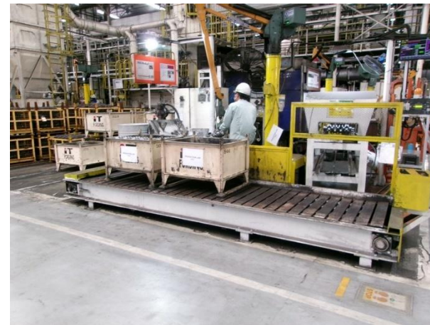
รูปที่ 2-35 ฐานรองเพื่อลดความสูงของรางลำเลียงชิ้นงานที่ออกจากขั้นตอนการผลิตลงสู่กระบะเหล็กรองรับชิ้นงาน