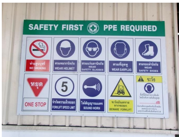
รูปที่ 2-3 ติดป้ายห้าม ป้ายบังคับ และป้ายเตือน การสวมใส่ PPE บริเวณก่อนเข้าอาคารผลิต