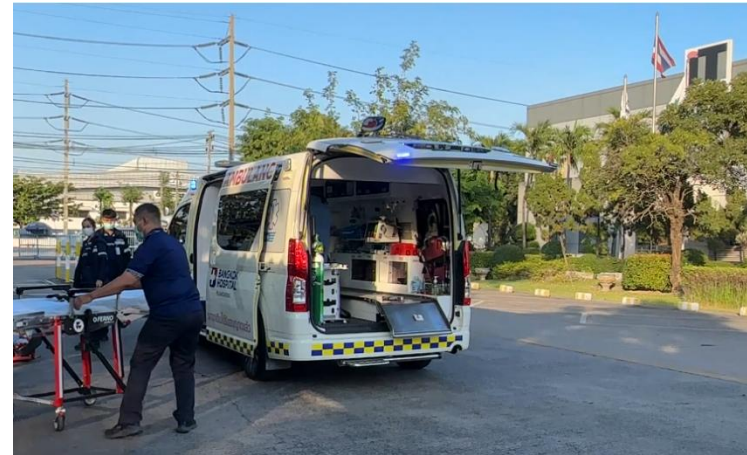
รูปที่ 2-58 รถพยาบาล