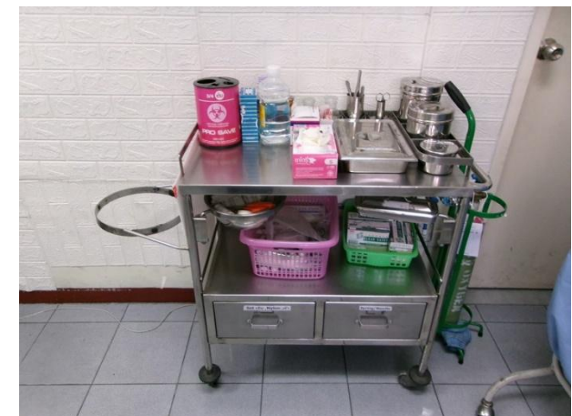
รถเข็นเครื่องมือแพทย์