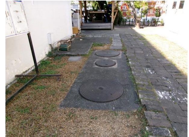
รับน้ำเสียจากห้องน้ำ-ห้องส้วมสำนักงาน