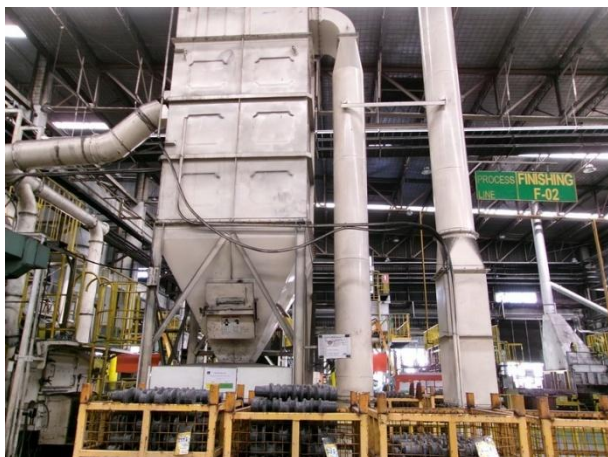
รูปที่ 2-39 Big bag เพื่อรองรับฝุ่นละอองจากการเคาะฝุ่นออกเป็นจังหวะของระบบถุงกรองของเครื่องขัดผิวชิ้นงาน และมีตัวปิดมิดชิด