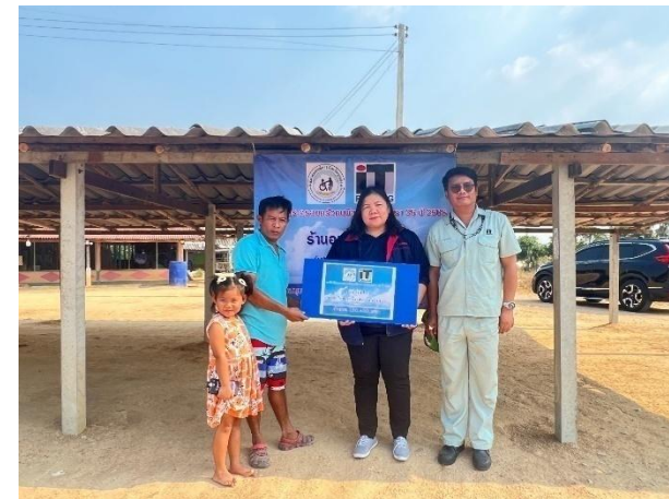
โครงการช่วยเหลือผู้พิการ 31/1/25

รูปที่ 2-53 กิจกรรมส่งเสริมความสุขสู่ชุมชน