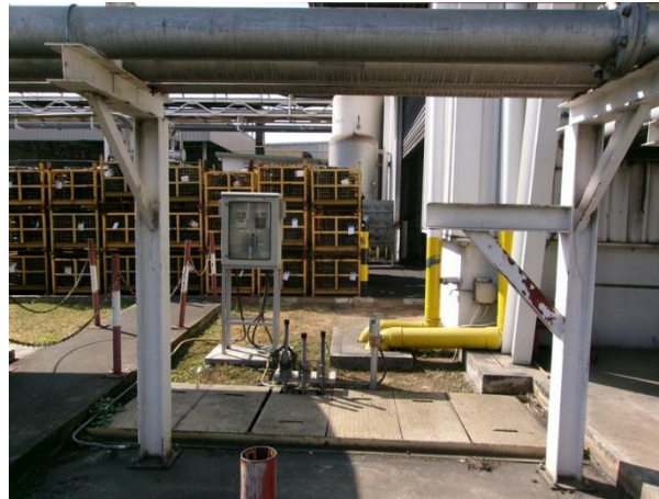
Cooling water return pit 5