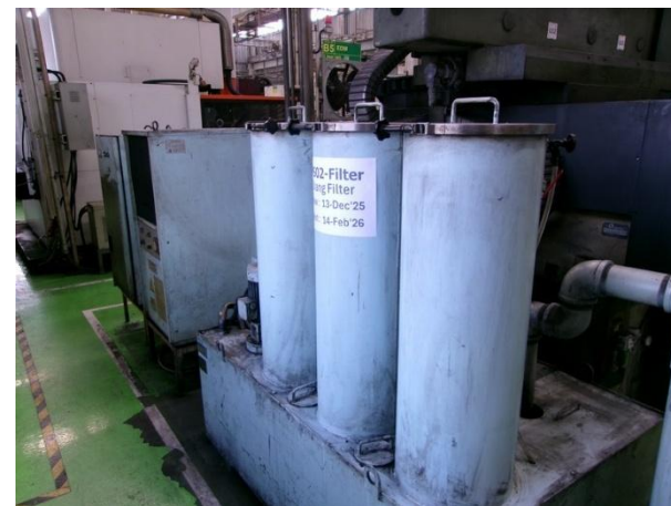
รูปที่ 2-42 ระบบกรองน้ำมัน (Oil filter) ในขณะสูบน้ำมันกันสนิม