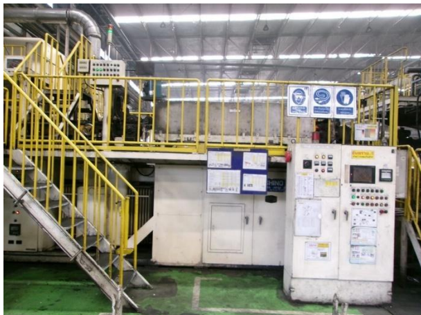
รูปที่ 2-30 แยกพื้นที่ระหว่างพนักงานและเครื่องให้ความร้อนเหล็กท่อน โดยติดตั้งเครื่องจักรบนชั้นลอย