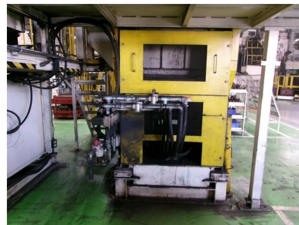
รูปที่ 2-33 Silencer ที่วาล์วควบคุมกระบอกลมเครื่องทุบ