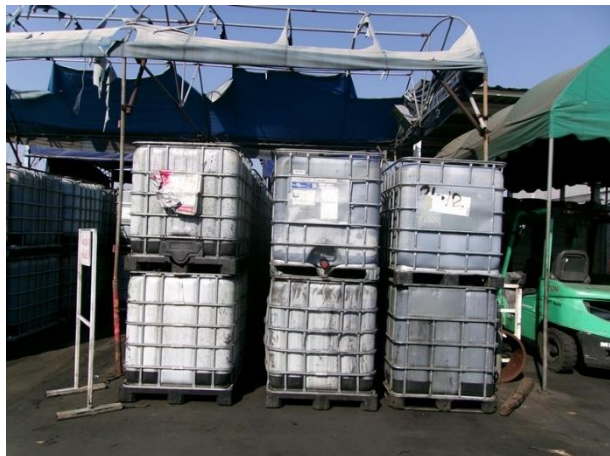
รูปที่ 2-19 ถังเก็บสำรองความจุ 1,000 ลิตร จำนวน 24 ถัง