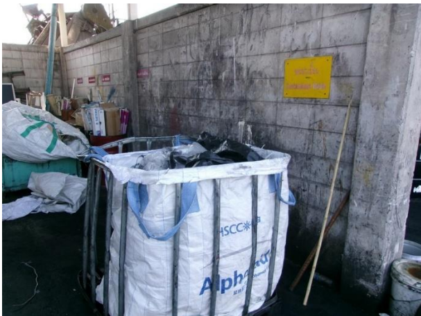
รูปที่ 2-23 เศษผ้า/ถุงมือปนเปื้อนน้ำมัน รวบรวมภายในโรงเก็บขยะ