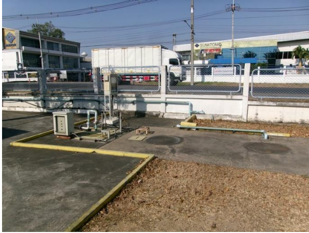
บ่อพักน้ำทิ้ง (ก่อนระบายไปยัง Sump pit 1)