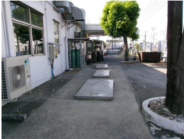
รับน้ำเสียจากโรงอาหารและห้องอาบน้ำ