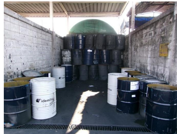
รูปที่ 2-24 ภาชนะปนเปื้อน รวบรวมภายในโรงเก็บขยะ