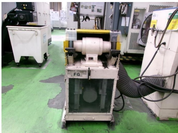
รูปที่ 2-41 พัดลมดูดอากาศเฉพาะที่ในจุดเชื่อม/ตัด