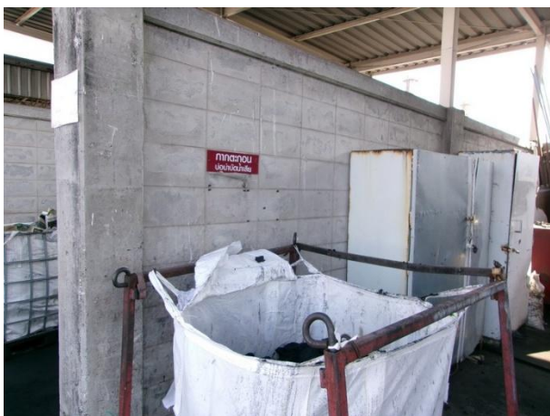
รูปที่ 2-17 ตะกอนจากระบบบำบัดน้ำเสีย ในโรงเก็บขยะ