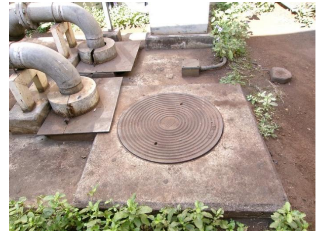
รับน้ำเสียจากห้องน้ำ-ห้องส้วมส่วนตรวจสอบผลิตภัณฑ์