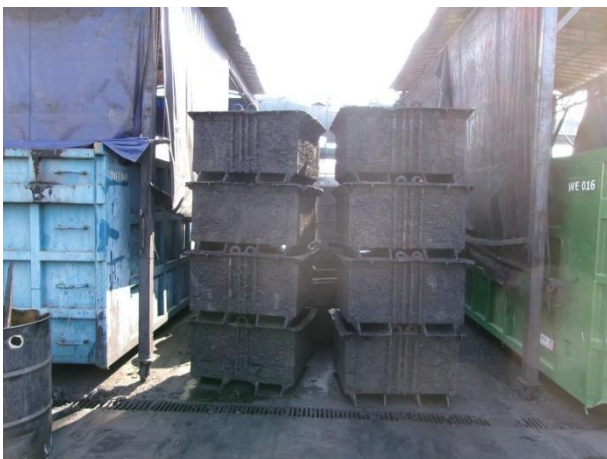
รูปที่ 2-25 รางดักน้ำมันบริเวณด้านหน้าของโรงเก็บขยะ (ภายใต้หลังคา)