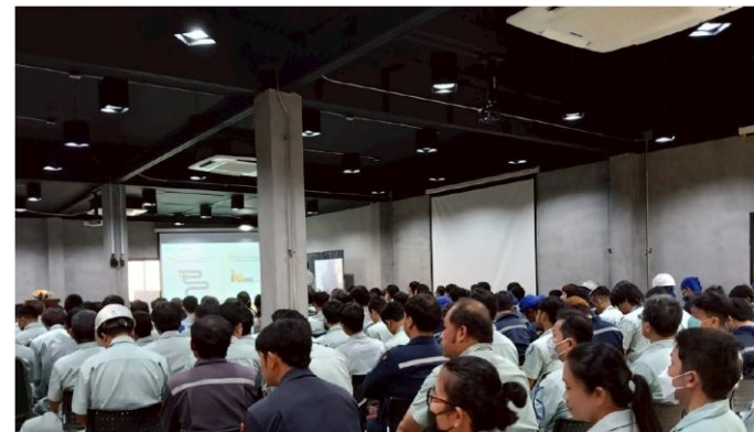
รูปที่ 2-52 การจัดฝึกอบรมให้ความรู้พนักงานเกี่ยวกับอันตรายจากเสียงดังและการสวมใส่อุปกรณ์ป้องกันอันตรายต่อการได้ยินที่มีประสิทธิภาพ