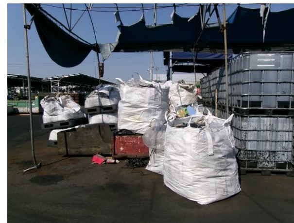
รูปที่ 2-22 ฝุ่นละอองและเม็ดเหล็กเสื่อมสภาพจัดเก็บใน Big Bag รวบรวมภายในโรงเก็บขยะ