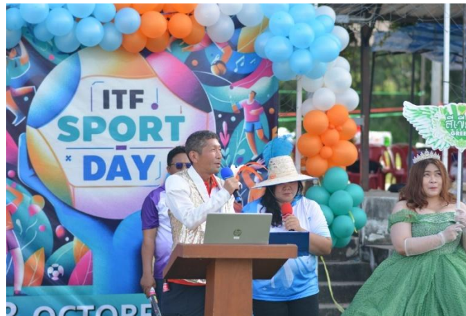
การแข่งขันกีฬาภายในบริษัทประจำปี 2568