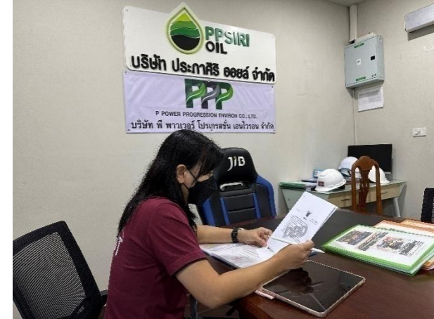
รูปที่ 2-11 การตรวจประเมินผู้รับกำจัดของเสีย