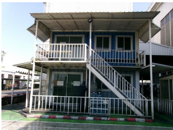
รูปที่ 2-32 ห้องพักงานของพนักงานในแผนกทุบขึ้นรูป