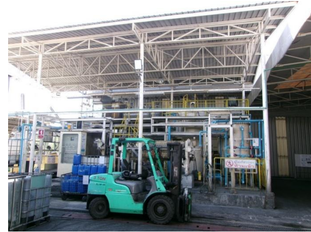
รูปที่ 2-5 ระบบบำบัดน้ำเสียทางเคมี