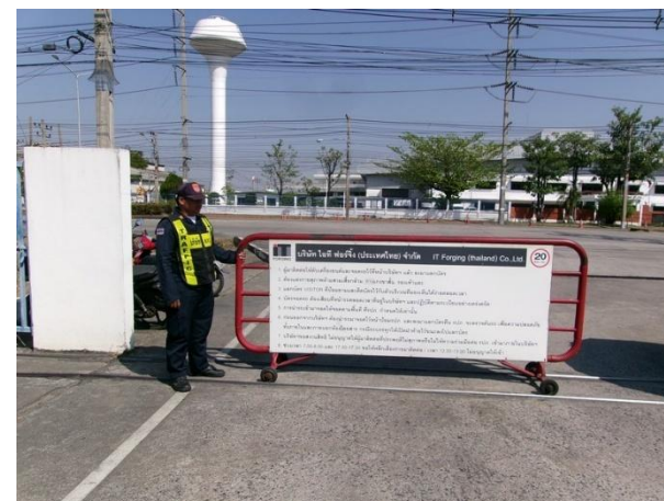
รูปที่ 2-29 เจ้าหน้าที่อำนวยความสะดวกและจัดระเบียบรถเข้า-ออกในพื้นที่โครงการ