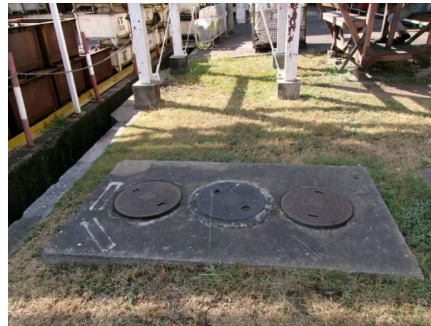
รับน้ำเสียจากห้องน้ำ-ห้องส้วมส่วนอบชุบชิ้นงาน