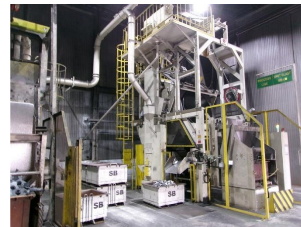
รูปที่ 2-36 ย้ายเครื่องขัดผิวชิ้นงาน (แบบถึง) ออกจากอาคารผลิต 1