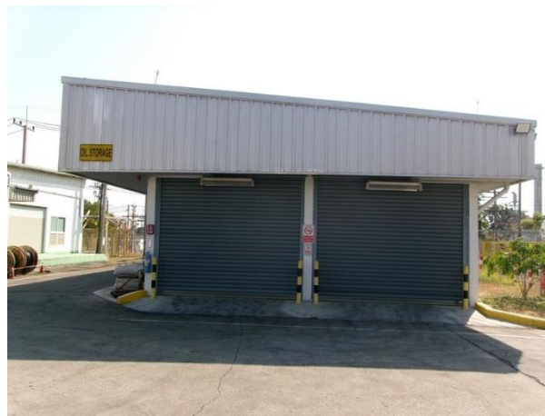
รูปที่ 2-49 การจัดเก็บสารเคมีไว้ในอาคารที่มีหลังคาปกคลุม เพื่อป้องกันการรั่วไหลลงสู่รางระบายน้ำฝน