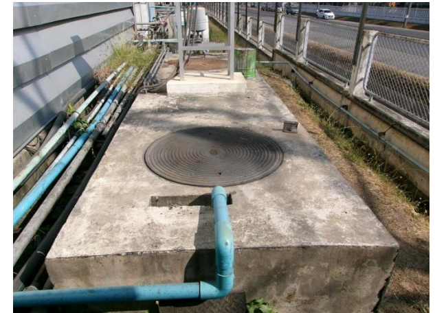
บ่อพักน้ำทิ้ง (ก่อนระบายไปยัง Sump pit 4)