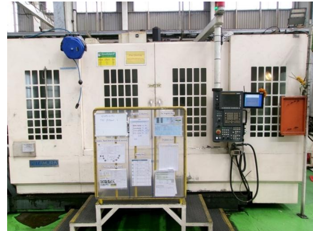
รูปที่ 2-48 เครื่องจักร CNC มีระบบ Interlock กรณีเครื่องจักรทำงานจะทำการปิดประตูอัตโนมัติ