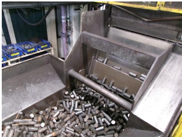
รูปที่ 2-34 ชั้นพักชิ้นงานในการลำเลียงเหล็กที่ร้อนของสายพานลำเลียงที่ไหลเข้าสู่ห้องอบให้ความร้อน