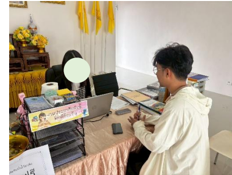
รูปที่ 2-56 การสำรวจสภาพสังคม - เศรษฐกิจ และความคิดเห็นของประชาชน