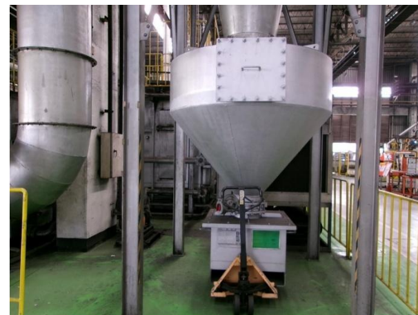
รูปที่ 2-38 Big bag เพื่อรองรับฝุ่นละอองจาก Cyclone และมีตัวปิดมิดชิด เพื่อป้องกันการฟุ้งกระจาย