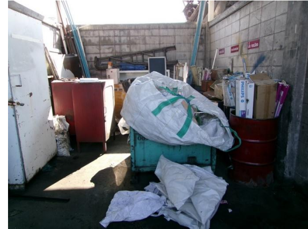
รูปที่ 2-14 โรงเก็บขยะอันตราย