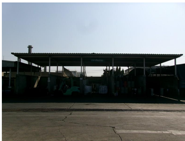
รูปที่ 2-10 โรงพักขยะเพื่อจัดเก็บของเสีย