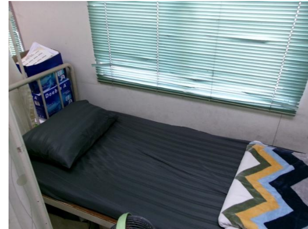
เตียงคนไข้