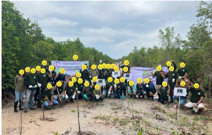
โครงการปลูกป่าชายเลน