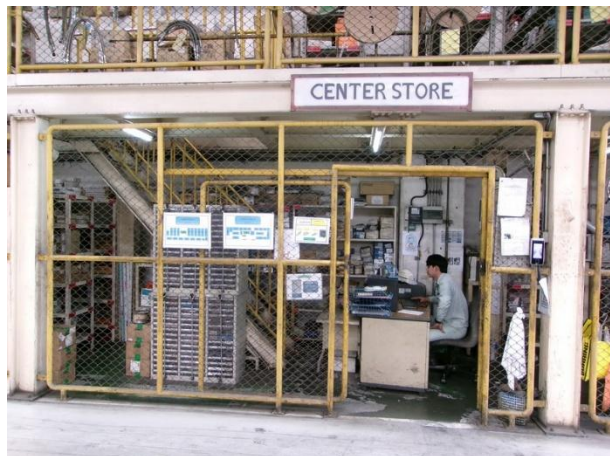
รูปที่ 2-8 อะไหล่หรืออุปกรณ์/เครื่องมือที่ใช้ในระบบบำบัดน้ำเสียสำรอง