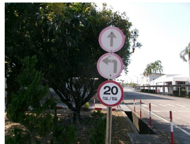
รูปที่ 2-28 ป้ายควบคุมความเร็ว