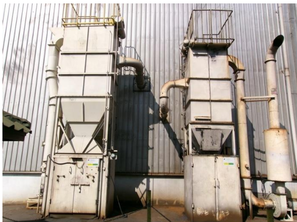
รูปที่ 2-37 ระบบบำบัดมลพิษทางอากาศแบบถุงกรอง ของเครื่องขัดผิวชิ้นงาน