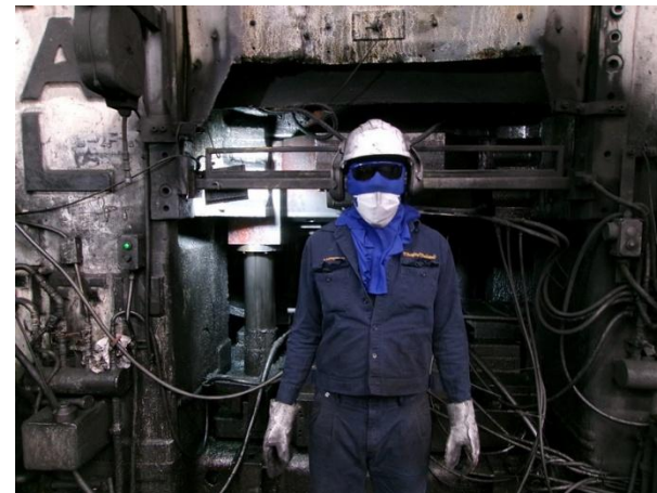
รูปที่ 2-2 พนักงานสวมใส่อุปกรณ์ป้องกันอันตรายส่วนบุคคลที่สามารถป้องกันอันตรายจากเสียงดัง