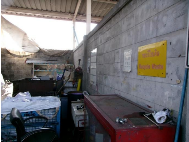
รูปที่ 2-13 โรงเก็บขยะรีไซเคิล