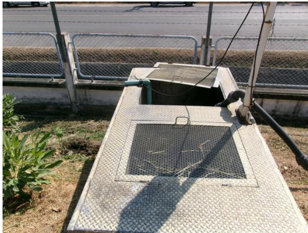
Sump pit 3