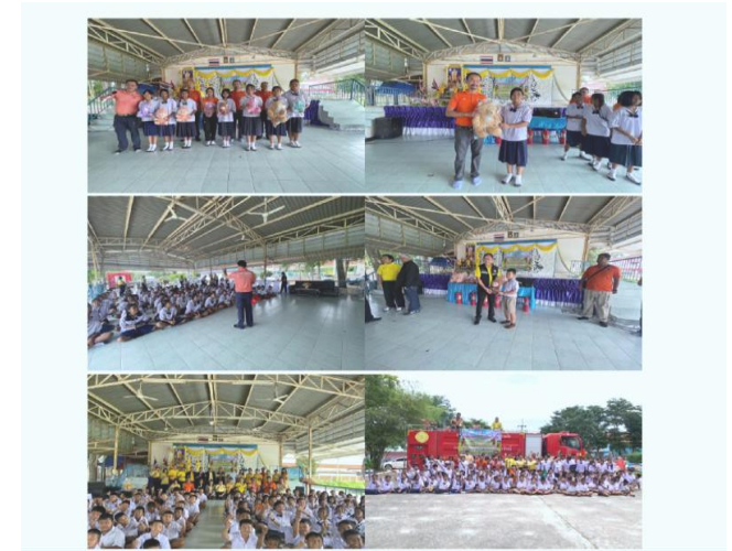
โครงการอบรมตอบโต้สถานการณ์ฉุกเฉินโรงเรียนบ้านหนองบอน