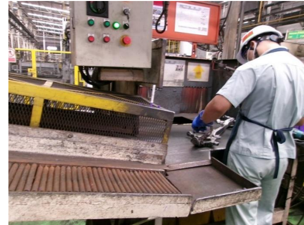
รูปที่ 2-46 การติดตั้ง Photo sensor เพื่อป้องกันเครื่องจักรหนีบ/กระแทก เกิดอันตรายกับพนักงานทำงานกับเครื่องตรวจสอบรอยร้าว