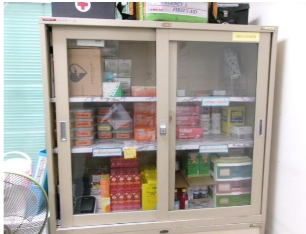
ตู้จัดเก็บเวชภัณฑ์