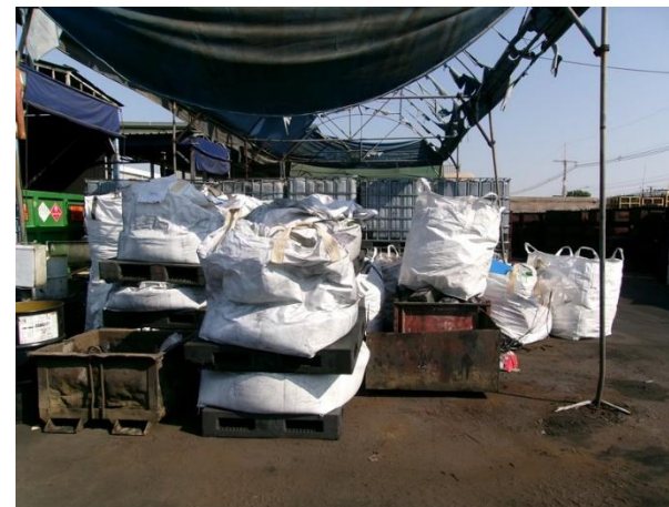
ฝุ่นจากระบบบำบัดมลพิษทางอากาศแบบ Cyclone