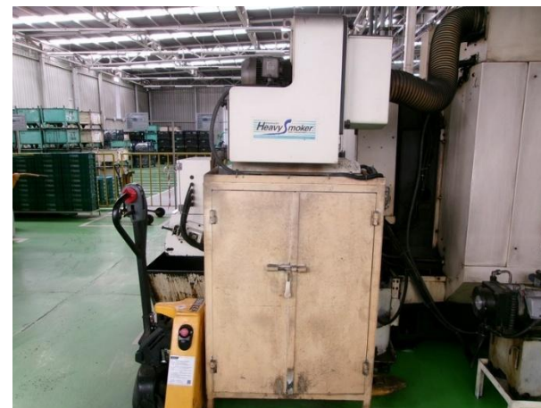
รูปที่ 2-40 ชุดกรองอากาศภายในเครื่อง CNC