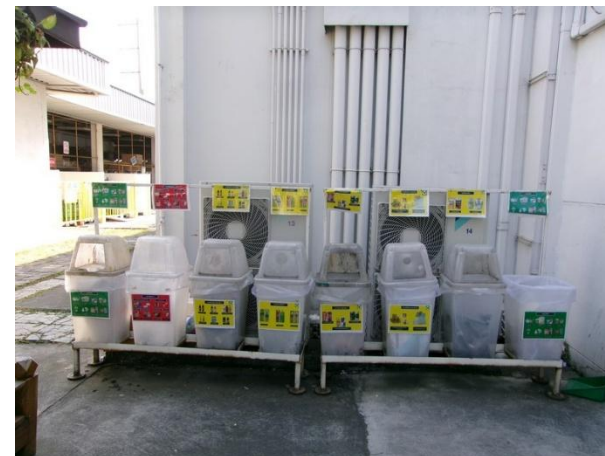
รูปที่ 2-9 ถังรองรับขยะมูลฝอย 3 ประเภท ได้แก่ ขยะทั่วไป ขยะอันตราย และขยะรีไซเคิล โดยถังขยะรีไซเคิลแยกออกเป็น 6 ประเภท