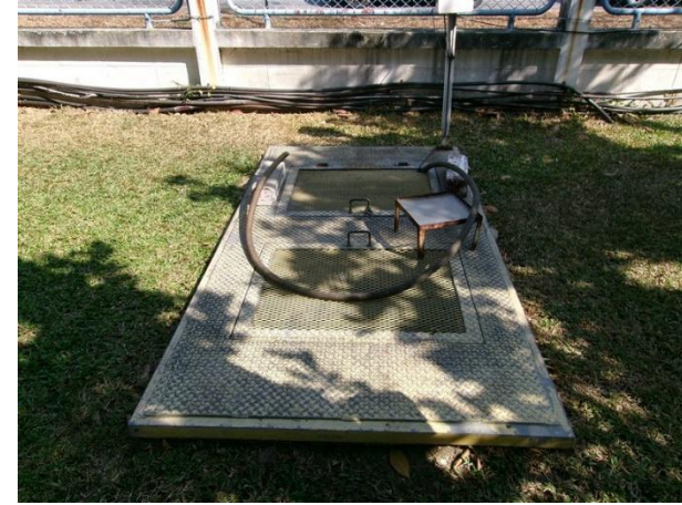
Sump pit 2