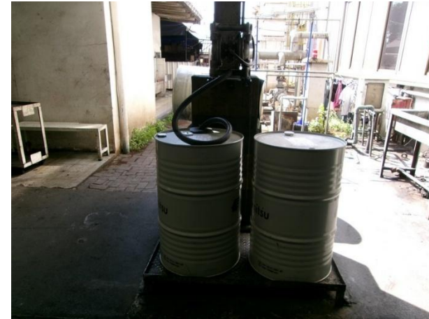
รูปที่ 2-51 การเปลี่ยนถ่ายน้ำมัน มีภาชนะรองรับที่มีฝาปิดมิดชิด