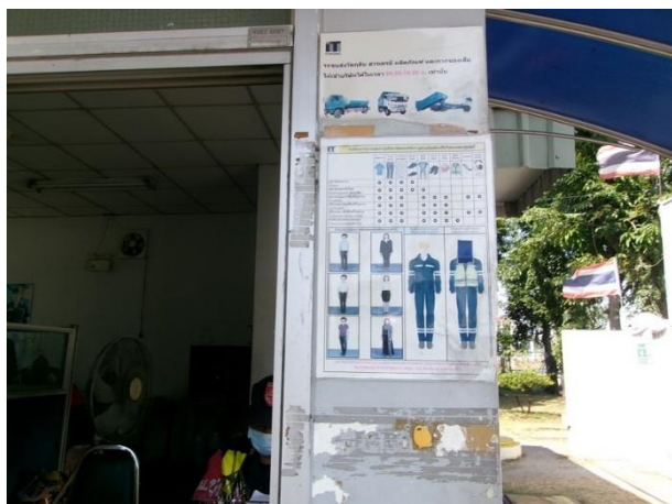
รูปที่ 2-27 ป้ายจำกัดเวลาขนส่งขนส่งวัสดุดิบ สารเคมี ผลิตภัณฑ์ และกากของเสีย