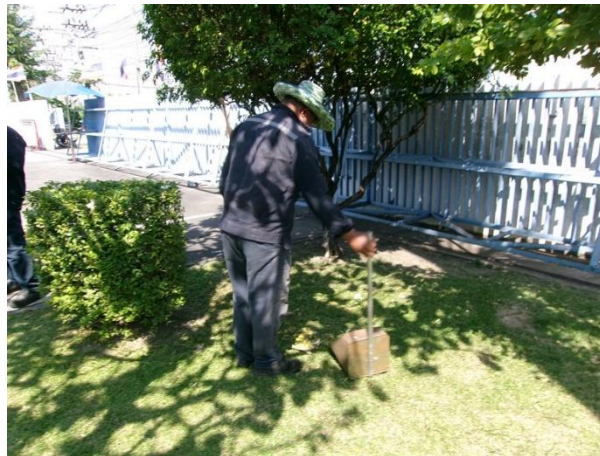
รูปที่ 2-59 การดูแลรักษา ใส่ปุ๋ยบำรุงดิน และต้นไม้