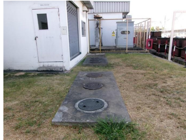
รับน้ำเสียจากห้องน้ำ-ห้องส้วมส่วนทุบขึ้นรูป 1